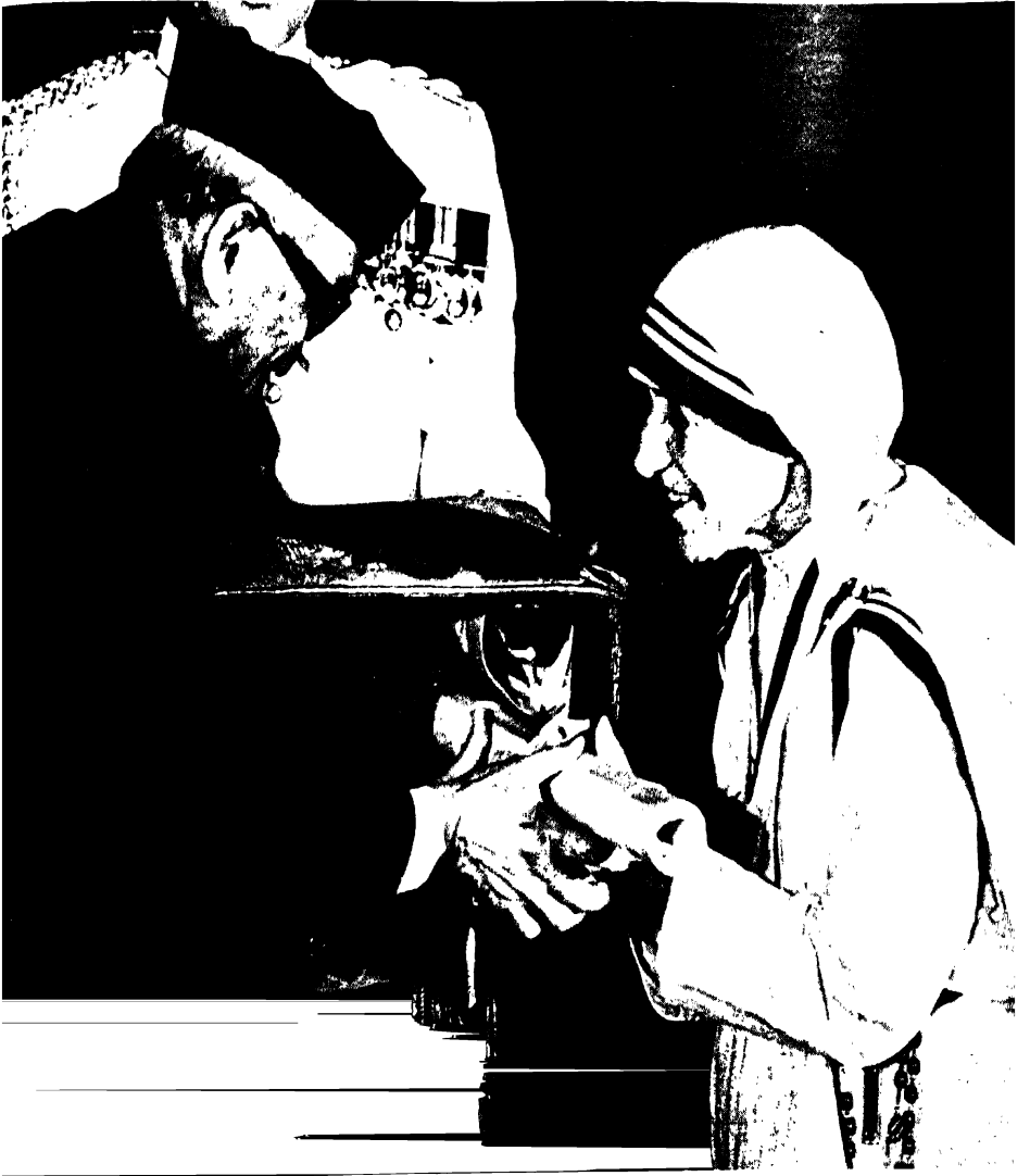
मदर टेरेजाले भारत रत्न प्राप्त गर्नु हुदैछे